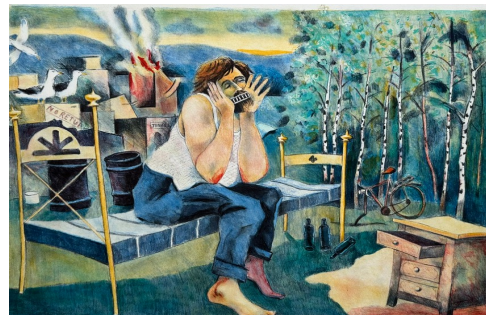
Ballad på en soptipp (ur Cornelissånger)