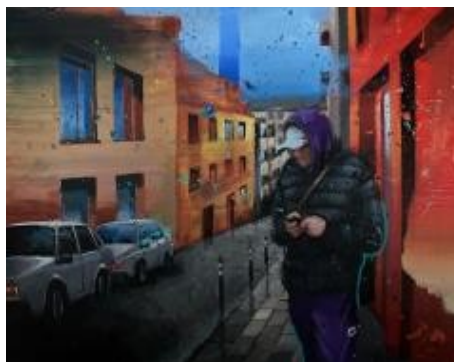
Inner city hangout